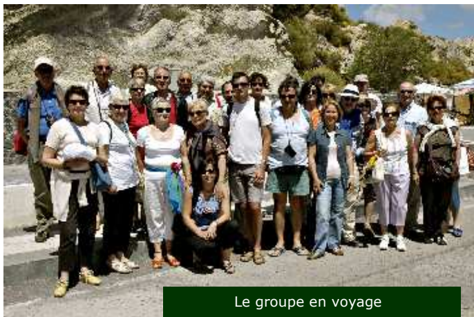
Le groupe en voyage