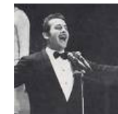
« Nel blu dipinto di blu »

Ma i brani musicali accompagnano qualsiasi momento della nostra vita. Provate a ricordare le ninne nanne di quando eravate bambini, le canzoncine dell'infanzia , quelle di Natale, la radio sveglia del mattino, le marce militari, le marce nuziali, le marce funebri. Oggi anche il vecchio squillo telefonico è stato sostituito dal ritornello di una canzone alla moda, e non ditemi di non avere una canzone che vi ricordi il vostro primo amore!