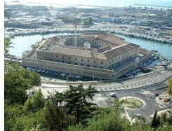
ncona - Mole Vanvitelliana