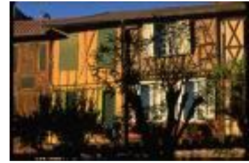
Mirepoix, maisons anciennes à colombages

Samedi 28 avril Sortie à Mirepoix (Ariège) Visite et repas au restaurant Contactez nous